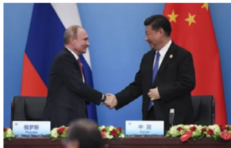
Presidente chinês Xi Jinping durante encontro com o russo Vladimir Putin

Campbell também pediu que a Europa expressasse suas preocupações sobre o apoio de Pequim a Moscou, sugerindo que medidas de vigilância reforçadas sobre as instituições financeiras poderiam ter "consequências significativas" para as relações internacionais. A China, por sua vez, negou fornecer armas à Rússia, afirmando manter uma posição "imparcial" no conflito ucraniano.