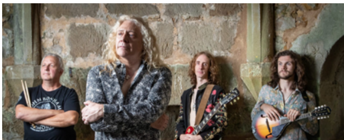
Aplaudidos: Letz Zep repassa discografia do célebre grupo inglês

chutara tudo pro alto e, blue-seiro devoto (às vezes surrupiador), aceitara juntar-se ao guitar hero Jeff Beck no inesquecível The Yardbirds.