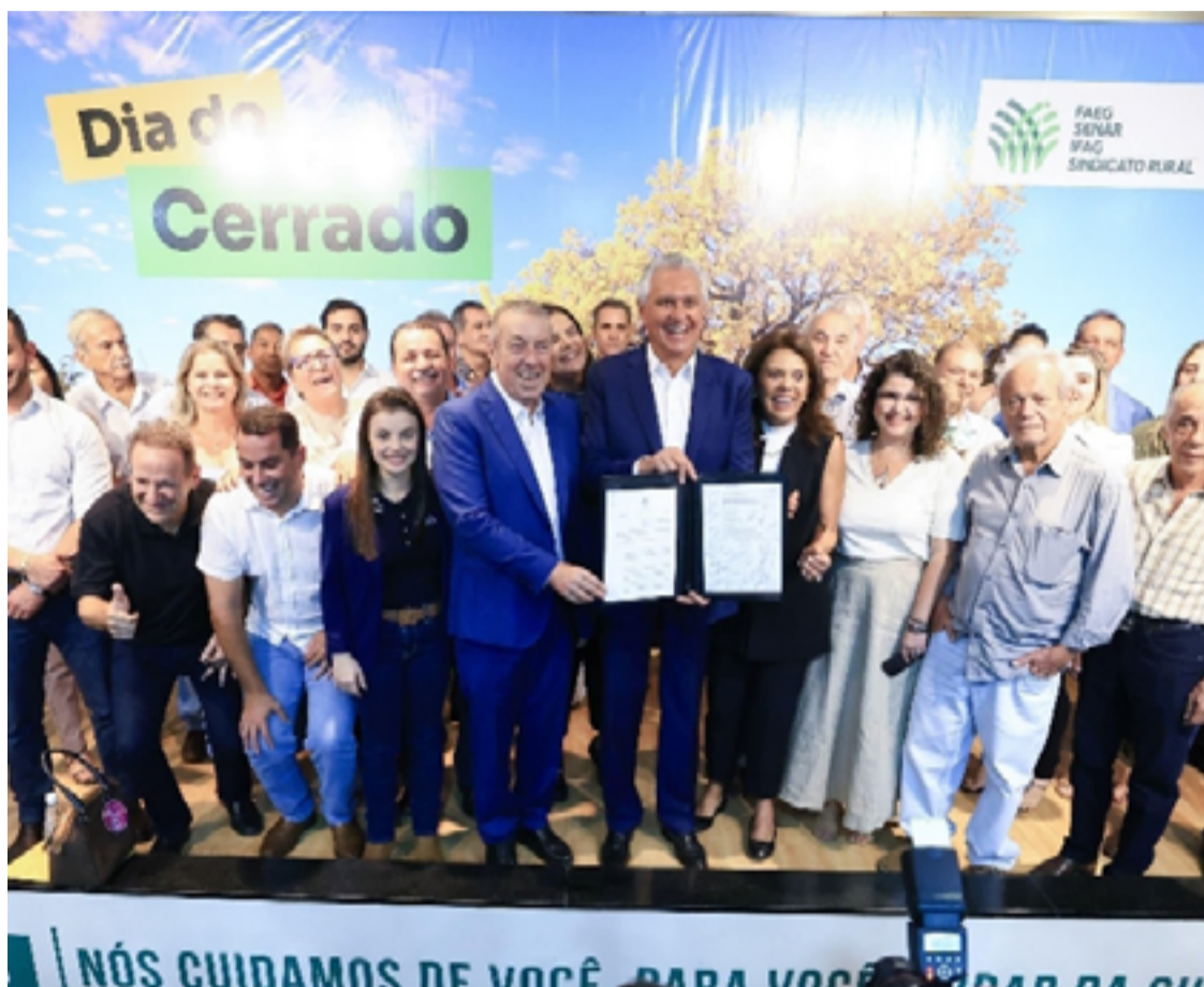
Governador Ronaldo Caiado durante lançamento do PSA: “nosso governo tem coragem de, dentro da casa do agro, falar de meio ambiente”

Programa que remunera produtores rurais pela preservação de áreas nativas foi lançado ontem pelo governador Ronaldo Caiado. Iniciativa prevê pagamento anual de R$ 498 por hectare, valor que pode chegar a R$ 664