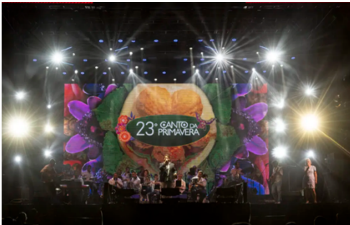
A Mostra Nacional da Música de Pirenópolis foi realizada de 3 a 8 de setembro, com shows locais, regionais e nacionais, oficinas formativas e gravações profissionais em estúdio.

A 23ª edição do festival é considerada o maior Canto da Primavera de toda a história do evento, com um investimento de R$ 3,3 milhões. Este ano, um número recorde de artistas subiu aos quatro palcos espalhados pela cidade, totalizando 60 apresentações e R$510 mil em cachês pagos aos artistas goianos. Entre as atrações nacionais, estavam: Maria Gadu, viabilizada em parceria com o Sesc Goiás, além de Marcelo Falcão e Toni Garrido.