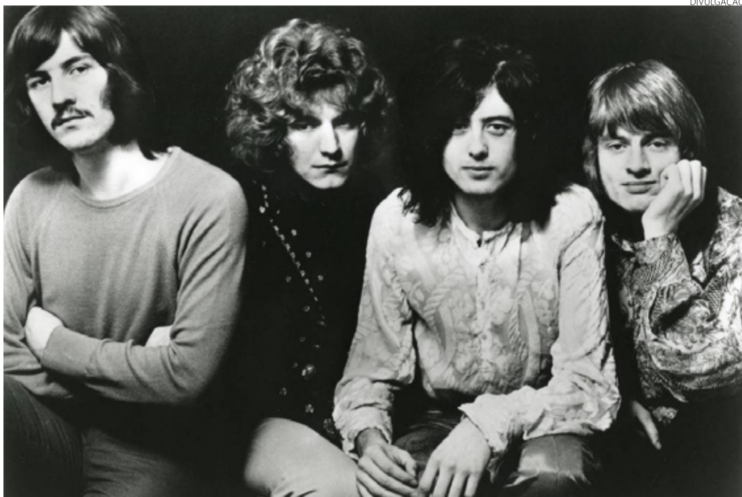
Som pesado: Led Zeppelin entrou para história da música ao acelerar blues no fim dos anos 1960

Prodígio em desvendar os mistérios da guitarra, Page destacou-se nos anos 60 pela capacidade em estúdio. Seus dedilhados, temas e riffs se fazem eternos em elepês gravados nessa época pelo The Who e The Kinks, até que