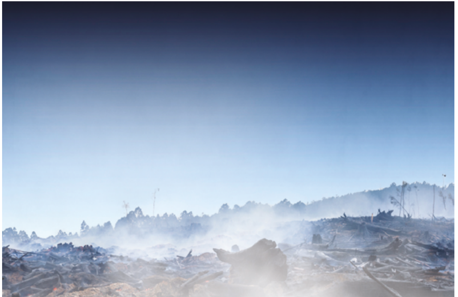
Atenção do Ministério Público de Goiás se volta aos incêndios que têm atingido áreas de matas e, também, urbanas; situação atual é a mais crítica da história

tora também fala sobre o papel da Secretaria Estadual de Meio Ambiente e Desenvolvimento (Semad) na adoção de estratégias, mecanismos e instrumentos econômicos e sociais para a melhoria da qualidade ambiental e o uso sustentável dos recursos naturais.