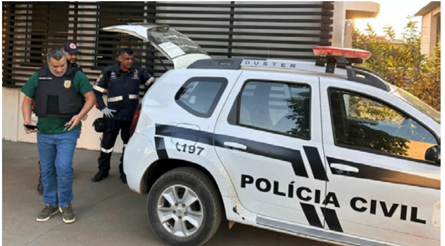
A rápida ação policial impediu sua fuga, permitindo a prisão em flagrante do investigado.

Com base em informações colhidas durante a investigação, a equipe conseguiu localizar a residência do suspeito. Ao chegar ao local, os policiais se depararam com o indivíduo tentando fugir, pulando o muro da casa com um revólver preso entre as pernas. A rápida ação policial impediu sua fuga, permitindo a prisão em