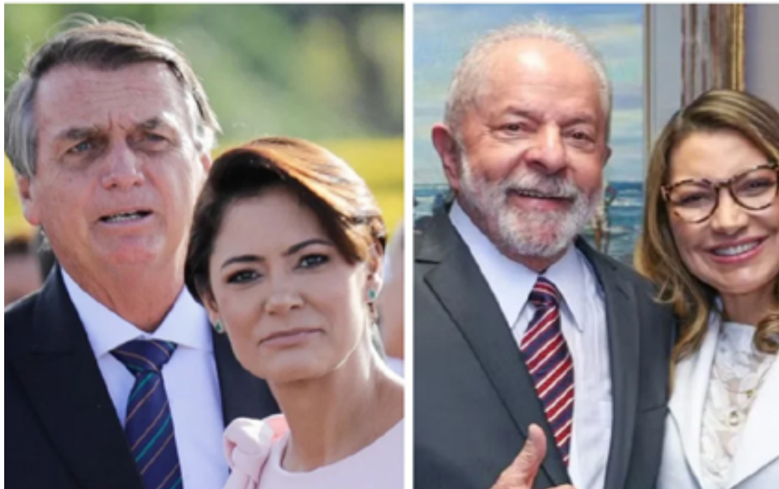
Jair Bolsonaro/Michelle e Lula da Silva/Janja

Agora, a Procuradoria-Geral da República (PGR) irá analisar o relatório e decidir se denuncia ou não o ex-presidente ao Supremo Tribunal Federal