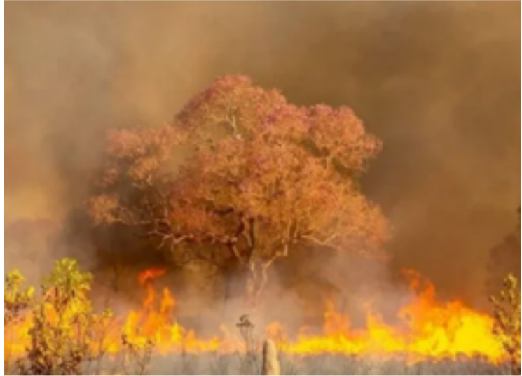
País registrou mais de 5 mil focos nas últimas 24 horas

O aumento no número de focos se deu no bioma Cerrado, que ultrapassou a Amazônia nas frentes de fogo e registrou 2.489 focos nesta segunda-feira (09)