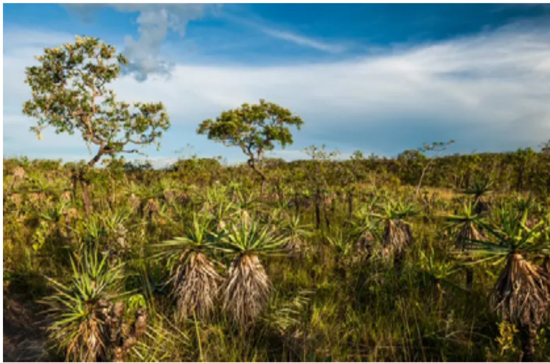
O seminário é aberto, basta fazer a inscrição e a participação é gratuita

O seminário é aberto, basta fazer a inscrição e a participação é gratuita. Das 9 às 12h, o assunto será a redução de emissões no setor de mudança de uso da terra e florestas em