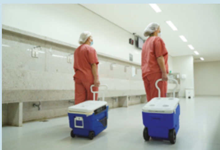
Comunicação automatizada por e-mail, inclui notificações de oferta de órgãos

O Sistema representa uma grande conquista para a Central de Transplantes, pois oferece um sistema abrangente que facilita a comunicação entre todos os envolvidos. Os hospitais habilitados, tanto públicos quanto privados, poderão acessar o módulo de credenciamento e enviar os documentos necessários.