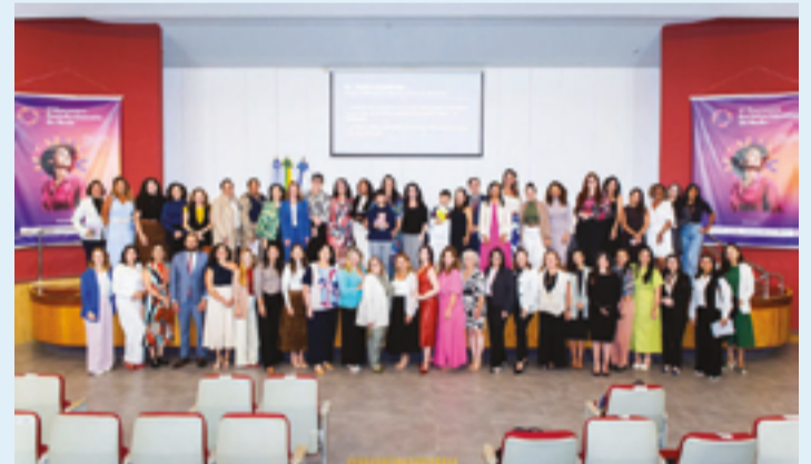
Comissão Permanente de Violência Doméstica e Familiar contra a Mulher (Copevid) foi parceira na realização do fórum nacional no Rio de Janeiro

Organizado pelo Centro de Apoio Operacional Violência Doméstica do MPRJ, em parceria com a Copevid, o Fórum Nacional de Juízas e Juizes de Violência