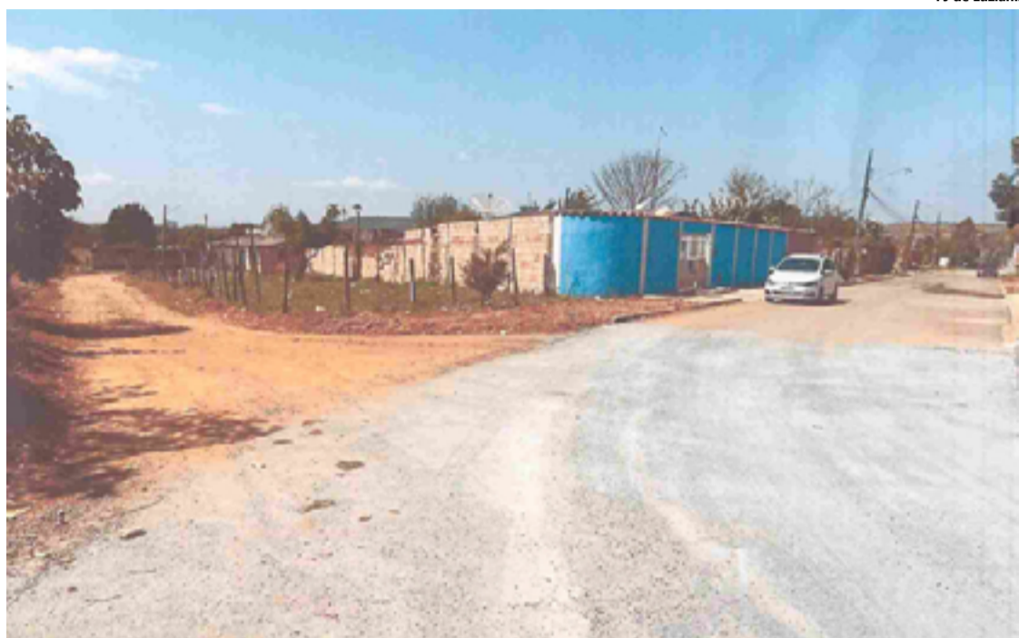
PJ de Luziânia

Conforme detalhado na ação pelo promotor de Justiça Julimar Alexandro da Silva, moradores do local foram à promotoria para relatar diversos problemas no loteamento, como ausência de fornecimento de energia elétrica, escoamento inadequado de águas pluviais, inexistência de pavimentação asfáltica, falta de